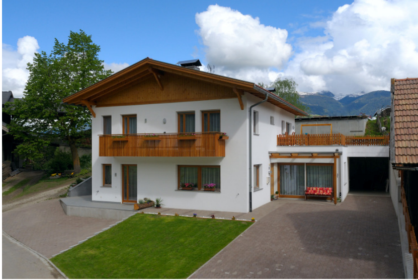
1000esima CasaClima “Mutschlechner”, CasaClima B